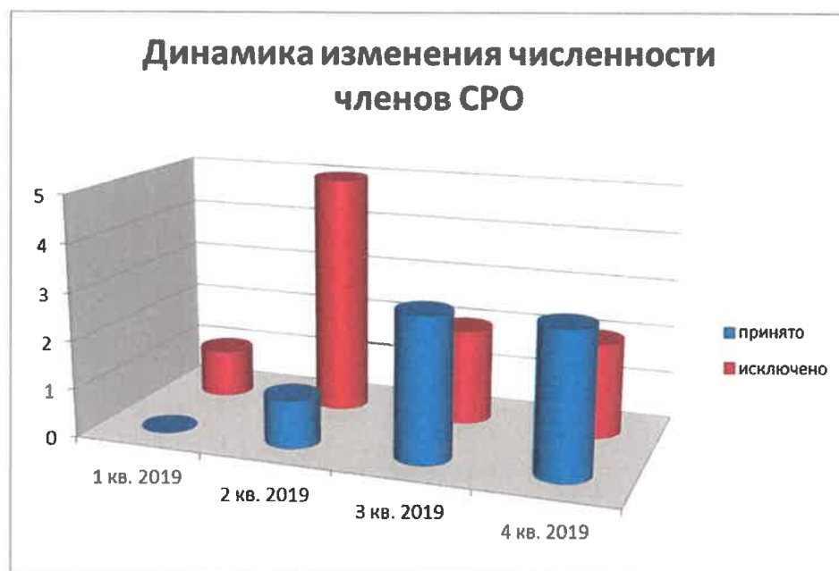
Диаграмма №1: «Динамика изменения численности членов СРО по кварталам»

Из исключенных членов СРО - 6 членов Союза добровольно вышли из состава СРО в связи с прекращением деятельности в области проектирования, 4 члена Союза исключены за несоответствие требования законодательства в части саморегулирования, в т.ч. за неуплату членских взносов в Союз.