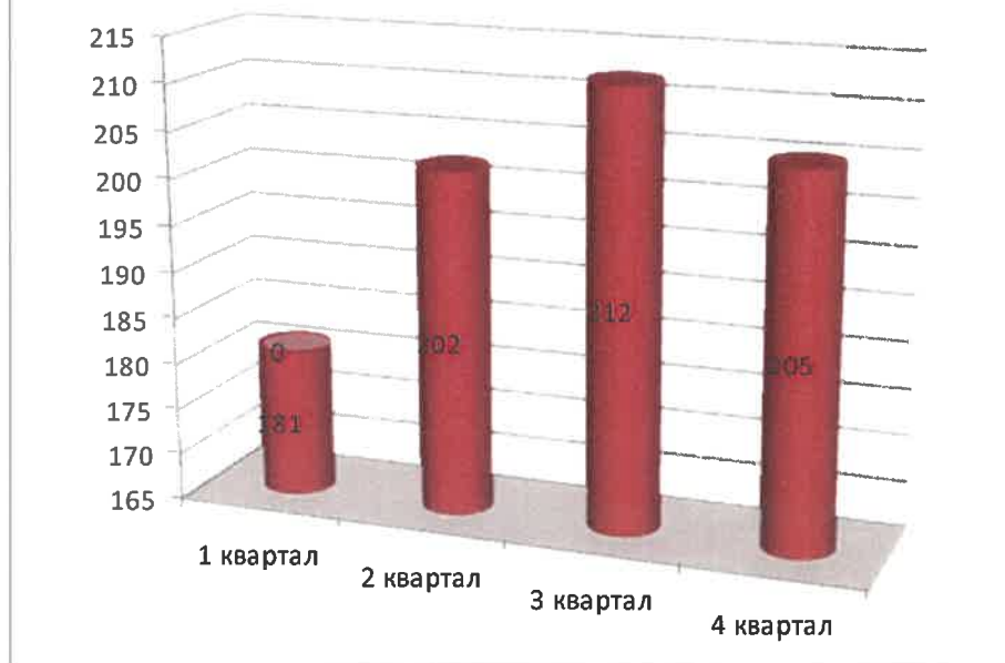
Диаграмма №2: «Динамика изменения количества выданных выписок по кварталам»