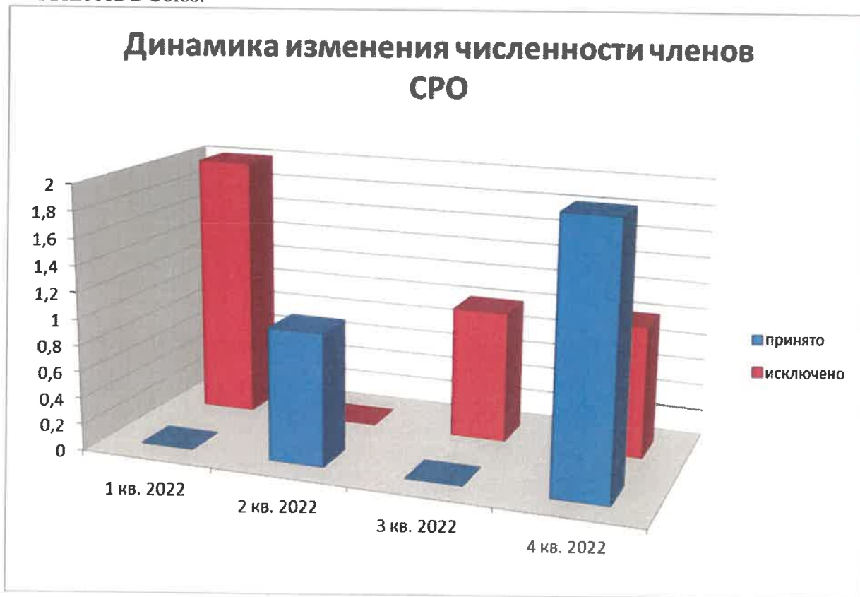
Диаграмма №1: «Динамика изменения численности членов СРО по кварталам»

Из исключенных членов СРО - 3 члена Союза добровольно вышли из состава СРО в связи с прекращением деятельности в области проектирования, 1 член Союза исключен за несоответствие требованиям законодательства в части саморегулирования, в т.ч. за неуплату членских взносов в Союз.