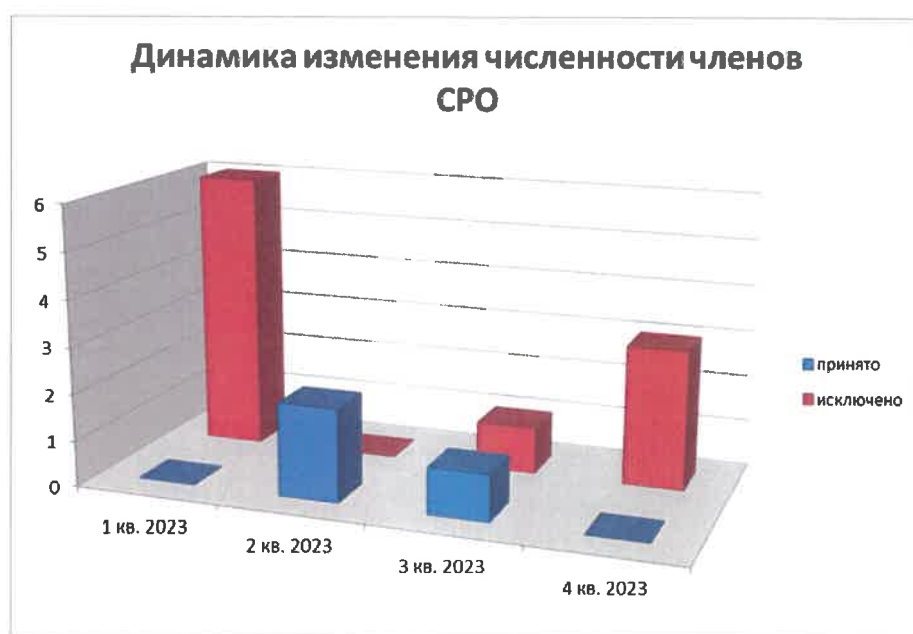
Диаграмма №1: «Динамика изменения численности членов СРО по кварталам»

Из исключенных членов СРО – 5 членов Союза добровольно вышли из состава СРО в связи с прекращением деятельности в области проектирования, 5 членов Союза исключены за несоответствие требованиям законодательства в части саморегулирования, в т.ч. за неуплату членских взносов в Союз.